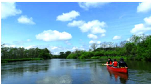
釧路川カヌー川下り体験