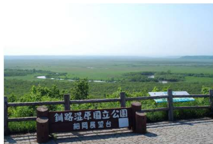
細岡展望台