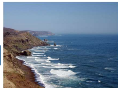
来止臥(キトウシ)からの眺望

カヌー川下りの際の注意事項 ・服装等は釧路マーシュ&リバーのホームページで必ずご確認ください。